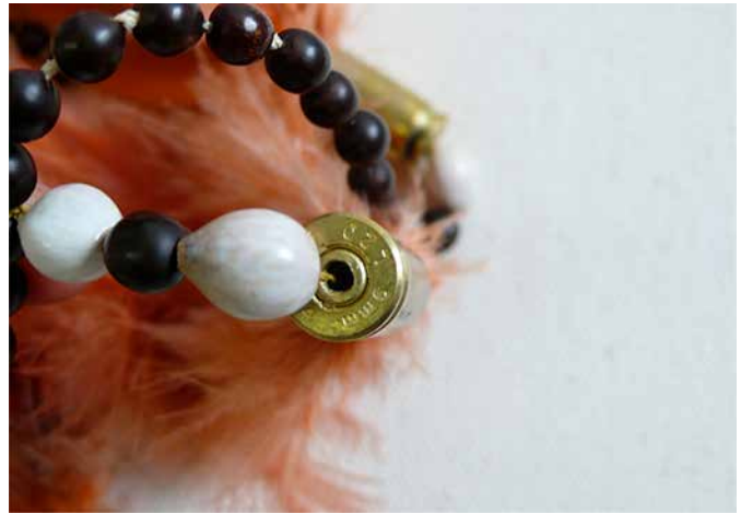
Bordados y Desbordados