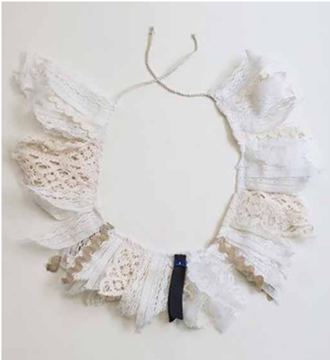
Cien Años y Desbordados